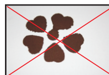
Obr.4 Pozor na zatékání barvy za šablonu