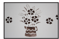
Obr.5 Výsledný efekt

V případě dotazů se na nás neváhejte obrátit na tel. čísle 773 670 934 nebo na emailové adrese info@jkrgroup.cz .