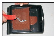
Obr.2 Důkladné otření válečku